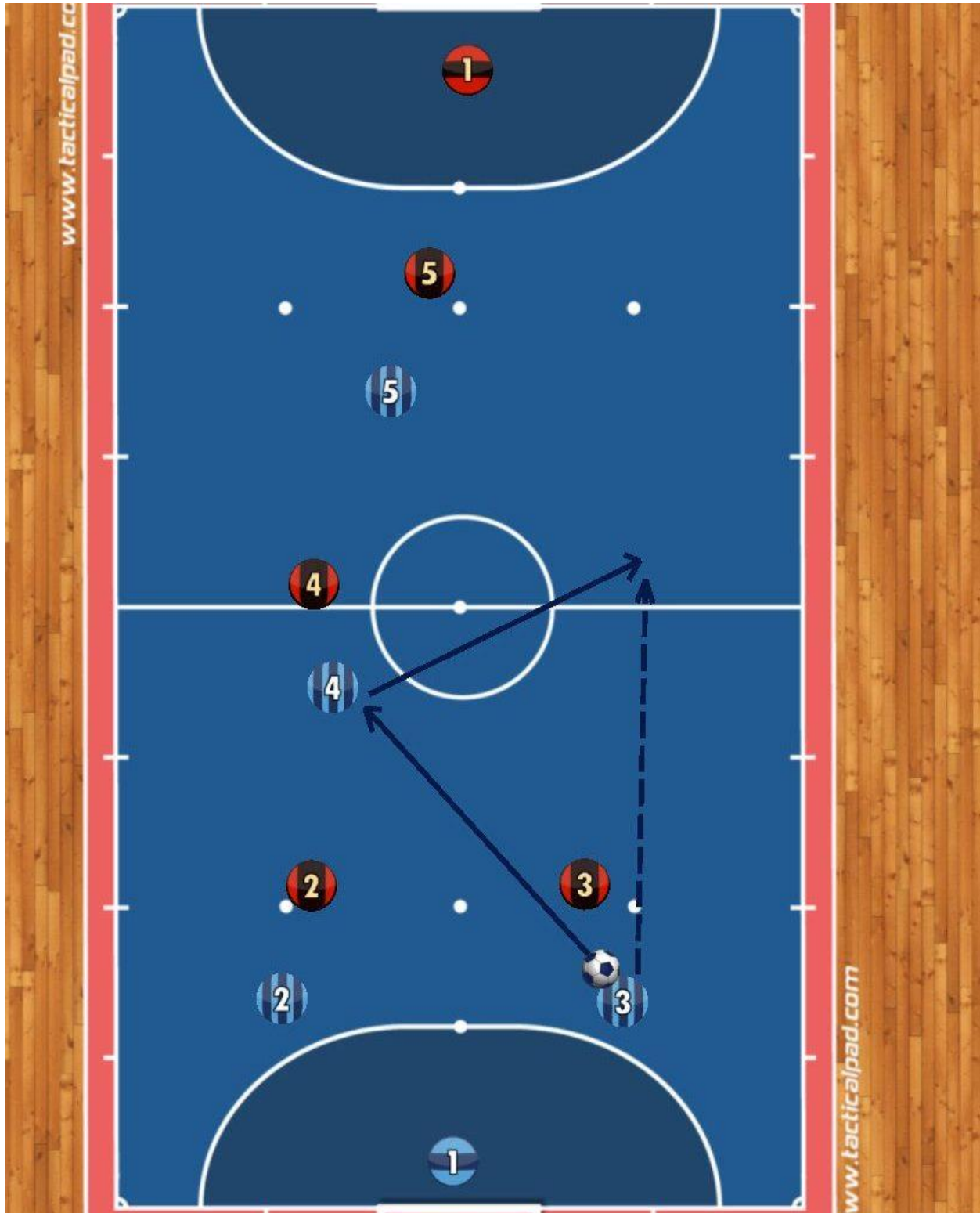
شکل 4: ایجاد فضا برای رسیدن هم تیمی ها

در مثال‌های بالا، توجه داشته باشید که بازیکن هدف به جزء ایستادن در نیمه حریف به‌سختی کار دیگری انجام می‌دهد. او حتی توپ را هم در اختیار ندارد. با این وجود، او با جاگیری هوشمندانه خود می‌تواند عضوی