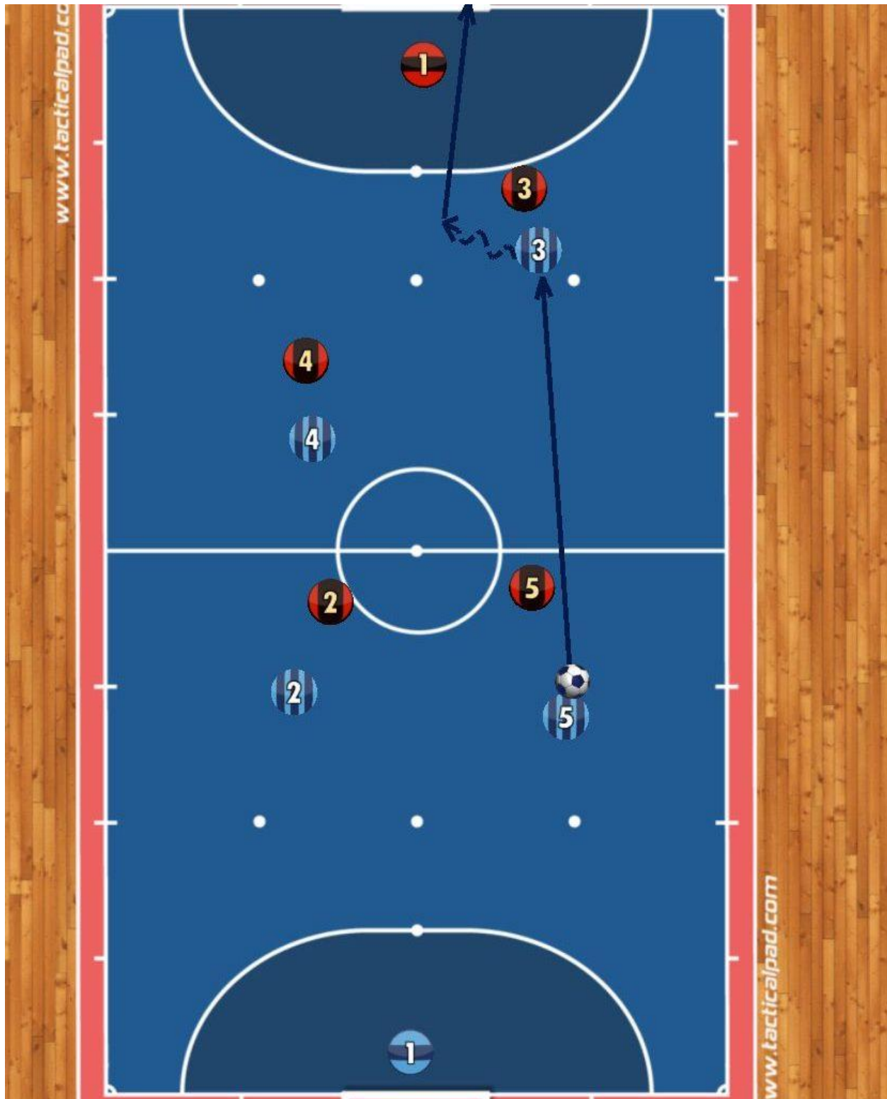
شکل 5 : چرخیدن بازیکن راس

شاید چرخیدن یک گزینه نباشد، اما بازیکن هدف هنوز می‌تواند توپ را به هم‌تیمی خود که در حال دویدن است، پاس بدهد. به این تصویر نگاه کنید.